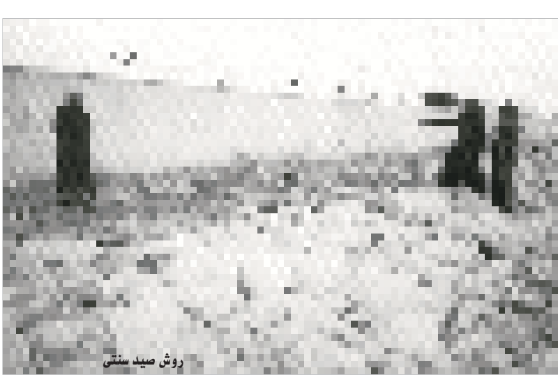
روش صید سنتی

✓ بازار ماهی بندرلنگه نیز فاقد سردخانه است که به دلیل عدم فروش بموقع آن ، اضافه روی دست ماهیگیران و ماهی فروش می ماند و ماهی فروش ناچار برای جلوگیری از فاسد شدن آنرا به قیمت ارزانتر به کامیونداران شهرهای مختلف می فروشد