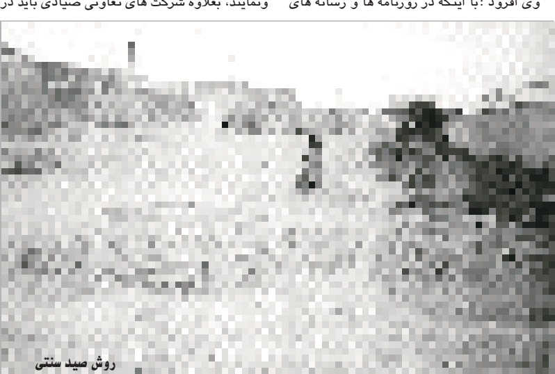
روش صید سنتی

افزایش در آمد و کاهش مهاجرت ساکنین منطقه به شیخ نشین ها ، سبب توسعه صادرات و جذب ارزبسیار برای کشور خواهد شد . تعدادی از صیادان با انتقاد از وضع موجود ، اظهار داشتند : ما با وضع موجود هر چند مدتی حدود سی تا چهل تور ماهیگیری خود را از دست خواهیم داد و آن هم به علت صید بی رویه و غیر اصولی کشتیها است که در این مورد یکی از صیادان توضیح داد چون به هنگام صید تور ماهیگیری ما که بنام (گرگور) است و همه آن در زیر آب و به وسیله طناب به هم وصل است و کشتی ها بوفه می کشند و زنجیر تخته بوفه این کشتی ها به طناب گرگور گیر کرده و آنها را با تور می برد و ما وقتی برای بهره برداری از گرگور ها می رویم اثری از آن نمی یابیم بجای اینکه صیدی بدست بیاوریم تور و وسایل خود را هم از دست داده و با دست خالی بسوی شهر باز می گردیم و ناچاریم دوباره با مشکلات زیادی رگرو نو تهیه و به همان محل مراجعه کنیم که باز احتمالاً روز از نو روزی از نو. وی افزود : با اینکه در روزنامه ها و رسانه های